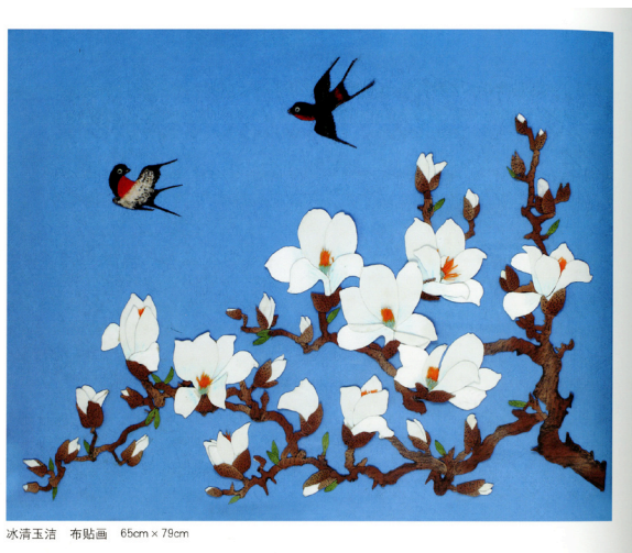
冰清玉洁 布贴画 65cm × 79cm

行，于是就开启了手工画的探索历程。正如人们所说，艺术的道路是艰辛漫长的，需要付出辛勤的代价，一步一步前行。她在做了充分思考和准备后，便开始制作，把不同颜色的纸剪成大小不同，形状各异的纸片，然后按画样粘贴，竟然成画。她的处女作是一幅少女像，身着红衣蓝裙，头系花头巾，手拿一束鲜花，寄托了她对青春时代的回忆。纸贴画做成后，虽说受到一些同志的赞赏，但她认为自己缺乏人体解剖学的基本知识，在认识和掌握人体结构和骨骼比例上是一个明显的短处，加上人物的表情细部，纸贴画不易表现。经过反复考虑，她下决心另辟蹊径，心想自己对颜色的搭配、尺寸的安排还有点心得，于是改学布贴画。同时她还考虑到，这和画手工画创作，在技艺上也有不少共通之处，学起来容易入门。主意已定，说干就干，她还专门去听专业老师讲课，回到家中按画样反复比较，不断调配，终于做成。现在挂在她家客厅的《冰清玉洁》便是她精心粘贴的第一幅布贴画作品。浅蓝色的画面，洁白的玉兰花迎空绽放，枝干横空而出，寓意作者对生活的热爱和迎难而上的坚毅精神。两只燕子如同报春的使者轻盈飞翔，构图精巧，充满了情趣，自己也比较满意。《冰清玉洁》的成功受到同事、亲友和业内专家的赞赏和认可，更增添了她要在艺术道路上继续钻研，不断前行的勇气和信心。经过一段时间的努力，她陆续创作了20多幅花鸟、人物的布贴画。其中收入画册的就有《鸟语花香》《花瓶百合》《穿和服女孩》《蜻蜓荷花》《兰天竹》《深秋》《寿桃》《百合花》等。这些布贴画，形象逼真，构图惟妙，清新明快，动静疏密，恰到好处，是她在手工画制作不断求索的印记和成果。