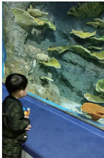
我的孙儿在海洋世界展窗前留影

在回归的路上，我心中仍然充满了意想不到的惊讶和欢愉。也可能是我离开老艺术家合唱团，特别是离开北京，定居宁德后，宅在家的时间太久了，对当今国家建设的变化太缺少感性的体验。原来只知道罗源是宁德附近的一座小县城，却想不到有了如此惊人的变化。回来后一直久久激动不已，从而使我坚信，咱们的中国梦必将实现！