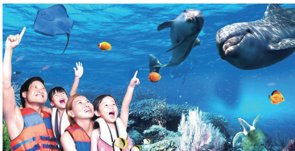
海底世界的观众们

福建省宁德市别称闽东，素有“海上天湖，佛国仙都，百里画廊”以及“大黄鱼之乡”等美誉。小城东临东海，与台湾隔海相望，西邻南平，南接省会福州市，北接浙江，是福建离“长江三角”和日本、韩国最近的城市。也是中国东南沿海休闲度假和生态旅游的胜地。遗憾的是我来宁德儿子家养老四年了，由于年迈和患腿疾，很少离开过市区去较远的景区游览。