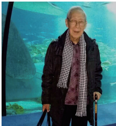
我在海洋世界展窗前留影

福建省宁德市别称闽东，素有“海上天湖，佛国仙都，百里画廊”以及“大黄鱼之乡”等美誉。小城东临东海，与台湾隔海相望，西邻南平，南接省会福州市，北接浙江，是福建离“长江三角”和日本、韩国最近的城市。也是中国东南沿海休闲度假和生态旅游的胜地。遗憾的是我来宁德儿子家养老四年了，由于年迈和患腿疾，很少离开过市区去较远的景区游览。