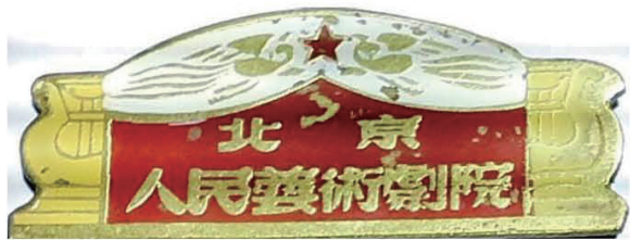
图片一：北京人民艺术剧院院徽

2015年，在《晚晴》第6期（北京市内部刊物）的一篇文章中，曾有一段对北京人民艺术剧院建立的描述：“早在63年以前，新中国刚刚建立，百废待兴，然而周恩来总理迅即提议：‘我们要成立一个专业的话剧院’，并且推荐由曹禺同志来担任院长。由于当时大家都以苏联的‘莫斯科艺术剧院’为样板，便取名叫做‘北京艺术剧院’。这件事传到了时任北京市市长彭真同志那里，他主动请命要求由北京市来经办和管理。同时，他还建议剧院的名称上，‘要有人民二字为好’。为此，经过政务院同意批准，剧院归属于北京市来建立，来管理，并且最后定名为‘北京人民艺术剧院’”。今年初，该作者在《北京青年报》上的一篇纪念周总理的文章中，将上述内容又演义为：“新中国建立不久，周总理立即想到并提出‘建立一个全国性的专业话团体，很有必要。’他问北京市委书记彭真这个团体你们要不要？”彭真立即表示北京市肯定要，又表示：‘这个话剧团可以叫做北京艺术剧院，但是全国已经解放了，我们认为再加上人民两个字为好。’于是在和周总理商量以后，正式确定‘北京人民艺术剧院’的名称。彭真进一步请示由谁来当院长。周总理胸有成竹地摆着手说：‘就让曹禺同志来当院长好了，他很合适。’”（此文即经《作家文摘》转载）。如此绘声绘色的描述，似乎作者身