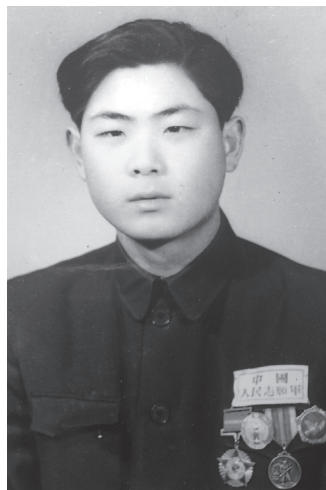
1952年在朝鲜，立功获军功章后，拍此照荣登光荣榜。

我们进入朝鲜的前两天，10月25日志愿军发起的第一次战役已经打响，第一批入朝的四个军的部队是10月19日过江的，埋伏在东西两线的深山峻岭中。中国政府曾向美国发出过警告，美军如果向北越过三八线，中国将不会坐视不管。美国不以为然，美军总司令麦克阿瑟更是说：中国不会也不敢出兵，即便出兵也是一群乌合之众，不是我们的对手，见到我美国大兵要吓得哭着逃窜。西线美国第八集团军，东线美军王牌第一骑兵师，大摇大摆向北挺进，麦克阿瑟下令，命令他们要饮马鸭绿江，在圣诞节之前占领朝鲜全境，结束战争，回家过节。殊不知他们已经钻进志愿军设下的包围圈。战斗突然打响，强大的攻击力，美军觉得人民军已无此力量。呀！中国军队，满山遍野向他们压去，志愿军入朝的第一仗，配置了10倍于敌的兵