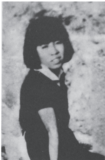
1938年母亲在从山西赴延安的路途中

你这么大岁数了，重新演赵师母，能够记得住台词吗？妈妈告诉我，她每接到一个角色，会在心里面把人物的性格、家庭背景和出场状态“吃透”；而且在做很多事情时，都在琢磨着角色的台