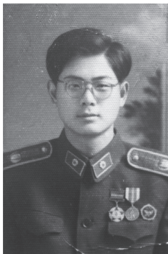
1956年着正规化文艺兵军装。

时，在陆地上建造钢架和钢梁，然后在桥墩竖起后，把在陆地上已经组建好的钢架钢梁一次性牵引过江，节省了一半的时间，创造了建桥史上的先例。1955年7月1日，我们乘坐第一列彩车过江，黎湛线全线通车。