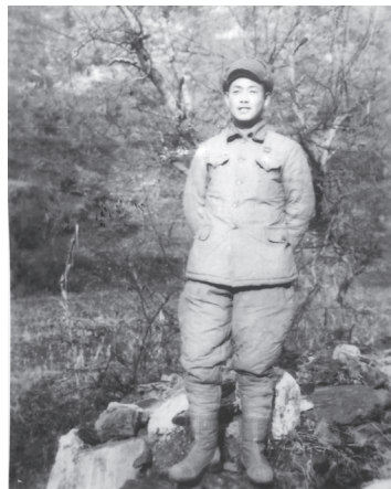
1952年10月于朝鲜沸流江畔。朝鲜半岛气温低，10月份已着冬装，穿的是志愿军干部服，十七岁的排级干部。

时炸弹的爆炸中。敌机在每次轰炸后，都投下一大片的定时炸弹，我们都工作在死亡线上。后来涌现出一位卸定时炸弹的能手李云龙，他冒着生命危险拆卸炸弹定时器，不仅保障了人们的安全，还将炸弹的钢和炸药得到充分的利用。李云龙的名称在全军传遍，被志愿军总部授予“特等功臣”和“卸定时炸弹英雄”称号。我将李云龙的英雄事迹编成单弦在全军演唱，一直唱到中南海，向中央领导汇报绞杀战的文艺晚会上。为此我荣立三等功，获军功章一枚。朝鲜战争是非常残酷的，但却是我军文艺活动最好的一段时期。我在1952年1月已经调到兵团文工团，文工团编制虽然比宣传队庞大，但在战时也是分班分组，分散地活动在部队里，与战士同吃、同住、共同战斗。在艰苦的战争环境里，为战士们营造一种健康向上的文化生活。战争三年，我们编演了多少英雄模范事迹已无法统计，如果合成全集名字就是“志愿军英雄赞”。不能忘记的还有朝鲜战争三年，祖国人民组织了三届赴朝慰问团，