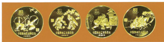
“中国奥林匹克委员会”金币：射箭、蹴鞠、摔跤、马术。

1979年10月25日国际奥委会宣布，全体委员表决以绝对多数通过了中国恢复参加国际奥委会，并授权制作“中国奥林匹克委员会”金银铜纪念币。该项目由国家体委主任和中国人民银行行长领导主持，中、美合作，世界发行。