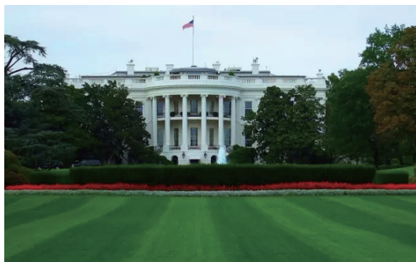
真实的美国南草坪

二战时期德意志第三帝国的宣传部长戈培尔的信条是：“谎言千遍，则成真理。”他认为，宣传的唯一目的，就是“征服民众”，宣传的基本原则就是不断重复，谎言要一再传播并装扮得令人相信。