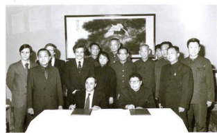
1980年2月，中、美双方为两套浮雕大图审定通过在北京饭店举办签字仪式。二排中间是设计者。

从总体看，纪念币的设计，主题鲜明，极富民族特色，又准确地体现了奥林匹克运动的精神，受到一致的赞许。接着，又被直接指定由她设计了“第十三届冬季奥运会”纪念币，正面同为国徽和面值，背面的图案是：高山滑雪、滑雪射击、花样滑冰和速度滑冰。整体设计姿态优美、动作潇洒，极富冲击力和感染力。经顺利批准后又着手绘制两套直径为15公分制作浮雕模具的素描大图稿。这两套纪念币，随即以金、银、铜三种材质在上海和沈阳两地造币厂制作完成，由中、美两国合作向全世界发行，深受各国钱币专家推崇和赞扬。其中“中国奥林匹克委员会”纪念币被称为“有史以来最罕见、最具独特风格的奥林匹克纪念币之一”。这期间，钟有