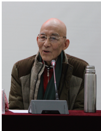
游本昌同志畅谈宣讲

按照《开展“畅谈十八大以来变化、展望十九大胜利召开”和“建言十九大”活动实施方案》安排，3月23日，文化部离退休干部局和离退休人员服务中心共同举办“畅谈十八大以来变化、展望十九大胜利召开”活动，邀请著名老艺术家彭清一、李光羲和游本昌同志，在文化部老年大学礼堂进行“畅谈”宣讲，文化部系统各直属单位离退休干部党务工作者、老干部代表、离退休干部工作人员100余人参加。