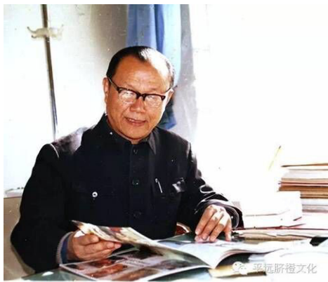
吕志先在文化部工作期间的工作照

11月6日，文化部部长雒树刚带领在京的所有部领导和司局长到八宝山送别百岁老人吕志先。习近平总书记、李克强总理、张德江委员长等党和国家领导人敬送的花圈摆放在灵前，足见吕老之哀荣。这是对他为我国的抗战、全国的解放、新中国的建设事业与改革开放、外交工作、文化交流做出贡献给予的肯定。