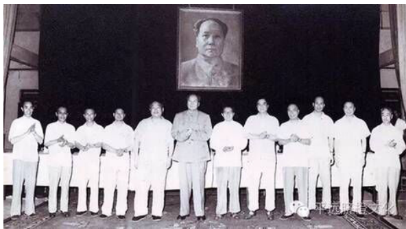
1960年，毛主席会见浙江省领导人，左三为吕志先

建国后，吕志先担任浙江省委宣传部长、秘书长、省委常委等要职。1962年5月，他被任命为省委常委兼杭州大学校长、党委书记。1965年1月，吕志先奉调国务院外交部工作，先后出任驻毛里塔尼亚、匈牙利、刚果、朝鲜大使。1981年，他被任命为中国对外文化交流委员会副主任，1982年，转任文化部副部长，党组成员，分管对外文化交流方面的工作。1986年他离开工作一线，任中国对外文化交流协会副会长。1988年，年逾七旬的他率团远赴非洲，为我国在海外建立的首批中国文化中心揭幕。2001年离休之后，他一如既往地关注国家的建设与发展，继续参与